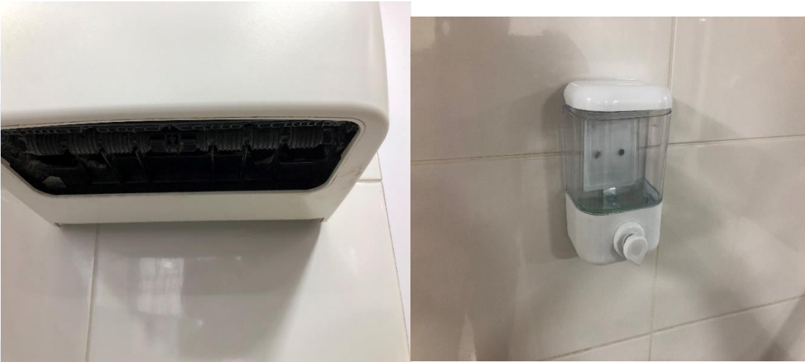
Baños tercer piso Edificio Alcaldía

registro fotográfico que se anexa a continuación, configurando un riesgo frente al contagio e incumplimientos normativos de nivel nacional.