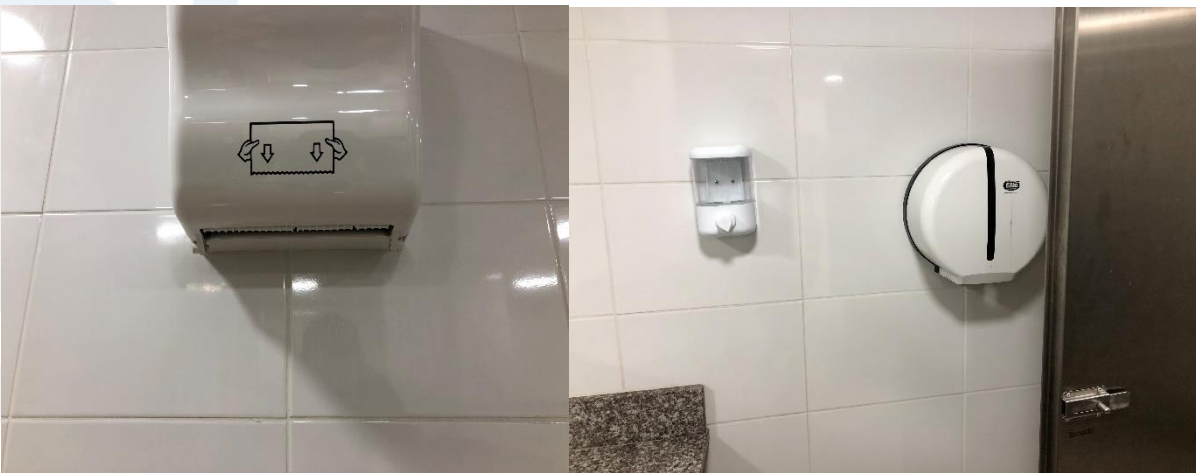
Baños tercer piso Edificio Alcaldía.