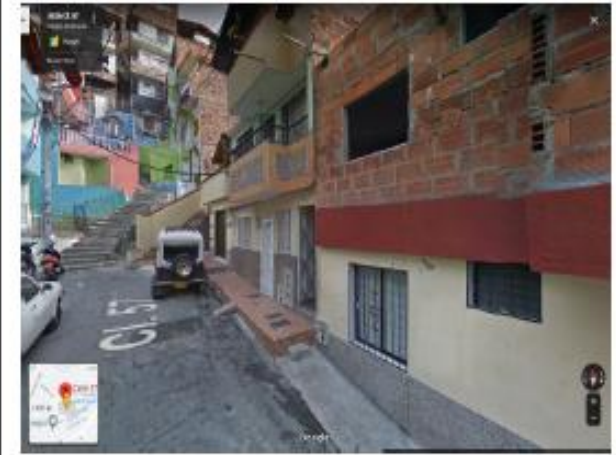
Calle 57 No. 54-51