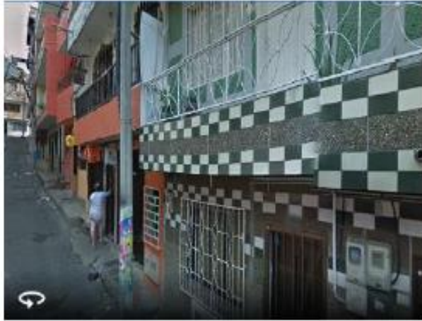
Cra 56 No. 57-18 Int 201