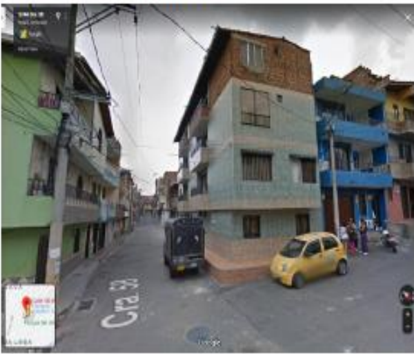
Calle 58 No. 58-11 Apto 401